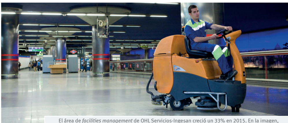
El área de facilities management de OHL Servicios-Ingesan creció un 33% en 2015. En la imagen, prestación de servicios de esta actividad en una estación de la red de Metro de Madrid.