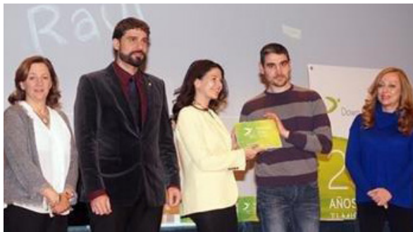
OHL Servicios-Ingesan recibió el Premio Stela 2015 concedido por la Fundación Down Madrid

Otro colectivo con el que OHL Servicios-Ingesan trabaja por su inserción sociolaboral es el de las personas privadas de libertad , a través de la formación en oficios y el trabajo productivo laboral.